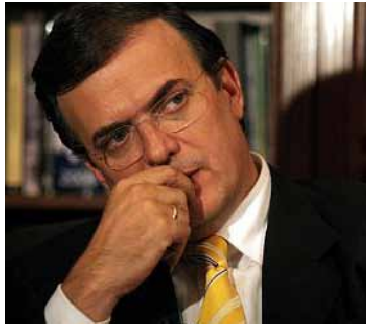
Marcelo Ebrard pretende "vender" la idea de que es víctima de una conspiración política.

Para empezar va a contratar esta semana un despacho de abogados para que estudien todas las opciones, ya que le da "terror" imaginarse tras las rejas. Para empezar se irá por la idea de que hay una conspiración política en su contra.