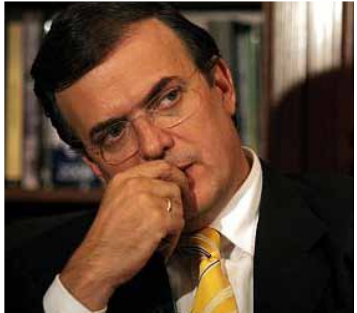
Marcelo Ebrard pretende "vender" la idea de que es víctima de una conspiración política.

Para empezar va a contratar esta semana un despacho de abogados para que estudien todas las opciones, ya que le da "terror" imaginarse tras las rejas. Para empezar se irá por la idea de que hay una conspiración política en su contra.