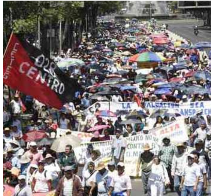
Las marchas de de la CNTE lograron imponerse ante la SEP para que cancelara los procesos de evaluación de los maestros.

La CNTE amenazó con impedir las elecciones en varias entidades, como Oaxaca, Guerrero, Michoacán y el DF, si la SEP no cancelaba esa parte de la reforma educativa. El lunes tiene previsto la CNTE hacer una fiesta de la victoria. Mientras tanto, millones de alumnos tendrán que soportar maestros faltistas, vándalos, deficientes y con un gran halo de impunidad.