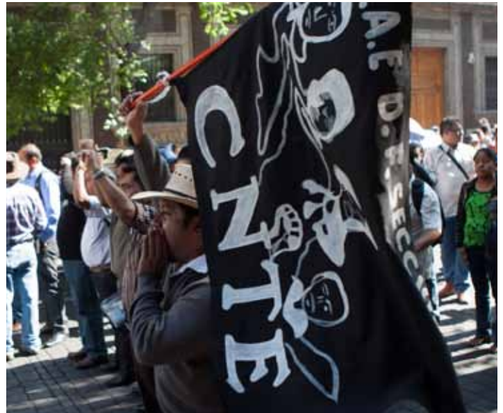
Con las marchas en el DF, ahora la CNTE va por la cancelación de la Reforma Educativa y, después, por el poder.

Las acciones violentas de la CNTE seguirán, como la toma de algunas sedes distritales del Instituto Nacional Electoral en Oaxaca, para boicotear los comicios del próximo domingo. Si la SEP pretendía calmar a la CNTE para no interferir en las elecciones, con la postergación de proceso de evaluación docente, lanzaron más leña al fuego y ahora la CNTE se siente poderosa no sólo en los estados donde tiene presencia, sino en todo el país. El error de cálculo del gobierno federal fue gravísimo. Abrieron la caja de Pandora.