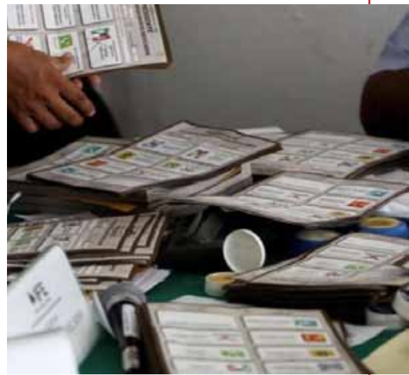
Si hoy fuera la elección para diputado federal, ¿por cuál partido votaría usted?