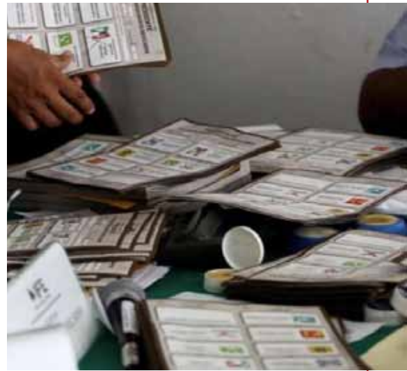
Si hoy fuera la elección para diputado federal, ¿por cuál partido votaría usted?