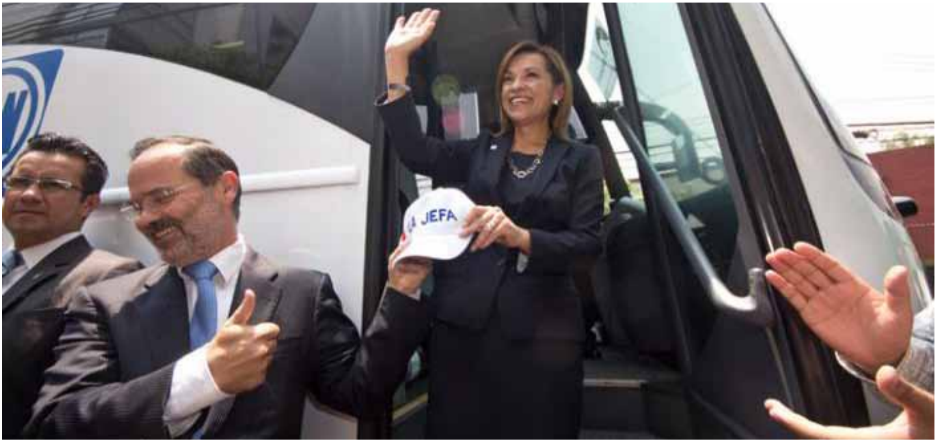
Josefina Vázquez Mota

tán muy lejos de ser planteamientos serios, propios de un candidato presidencial empeñado en llegar al poder.