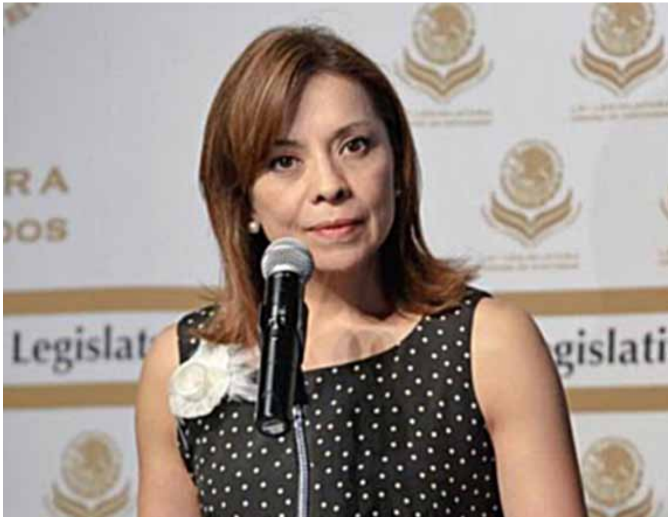
Josefina Vázquez Mota

Nacido como oposición leal y con un discurso de confrontación ética y moral al Partido cardenista de la Revolución Mexicana, el PAN no supo convertirse en partido en el poder en doce años de poder presidencial y en casi veinticinco años de ascender en la estructura política.