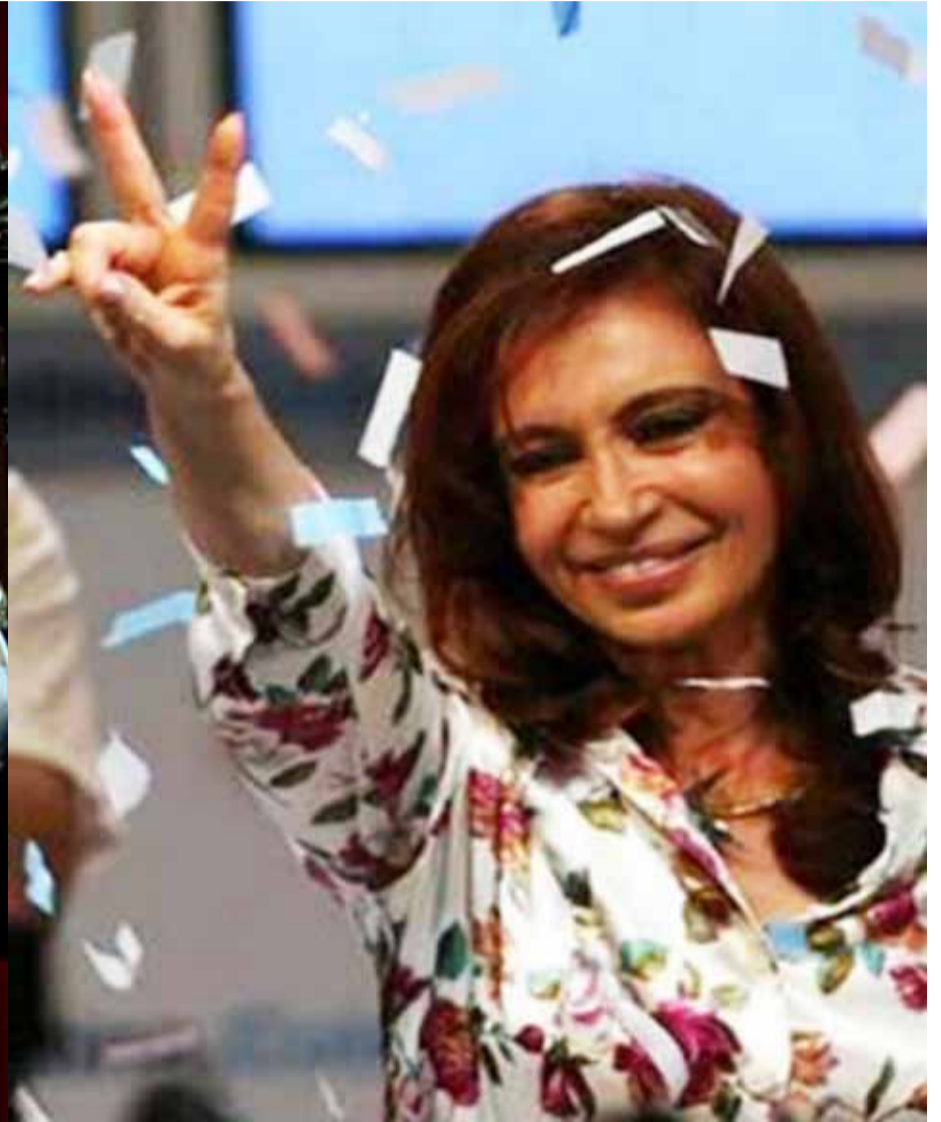
Cristina Fernández de Kirchner

A mediados del siglo XIX el dictadorzuelo en turno en Bolivia, General Mariano Melgarejo , convidó al embajador de Inglaterra a una francachelada en honor de su más reciente querida, invitación que el diplomático declinó. El líder ofendido ordenó que amarraran al inglés a un burro, sentado hacia su cola, y le dieron tres vueltas alrededor de la plaza mayor de La Paz.