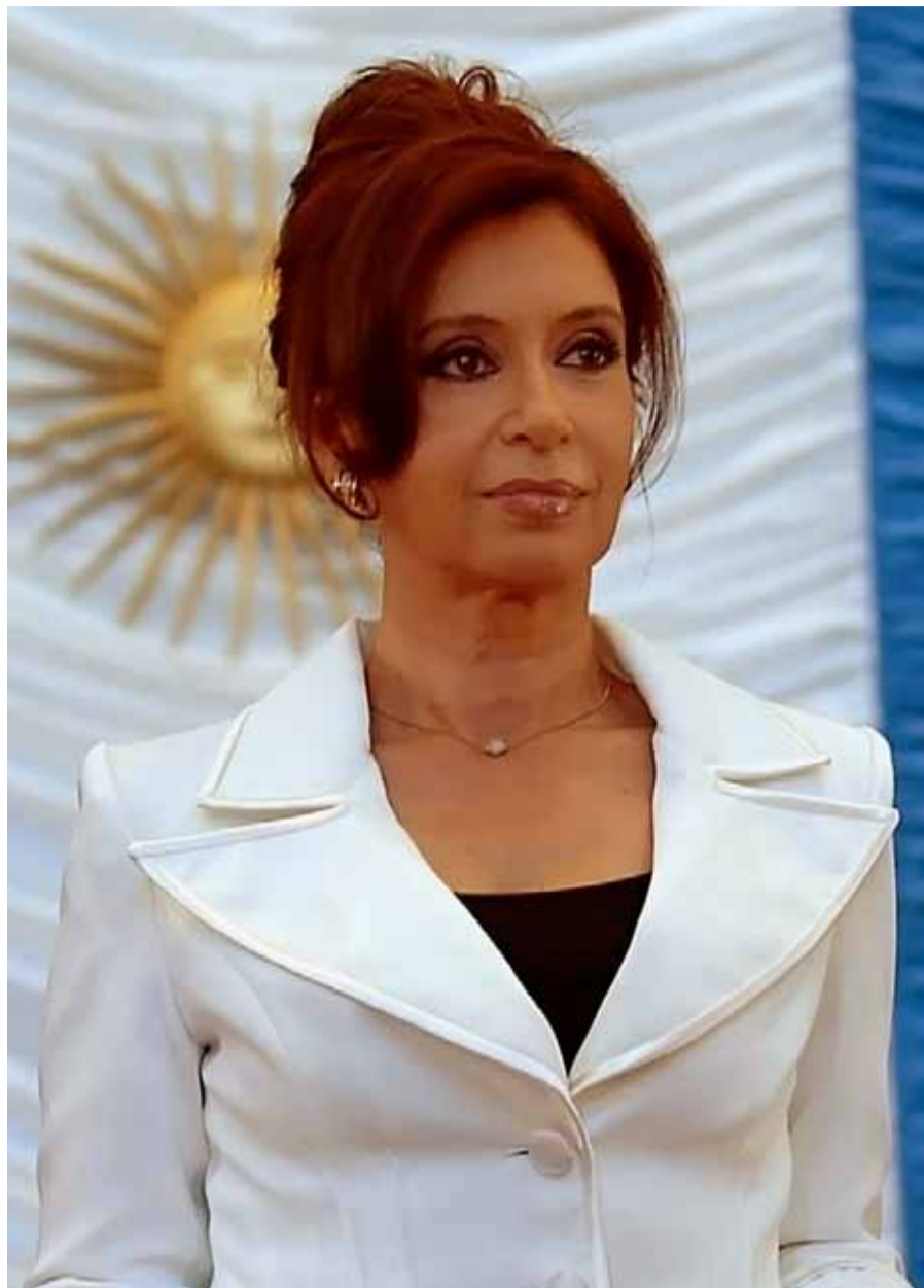
Cristina Fernández, presidenta de Argentina

Por su parte, la producción petrolera en América, incluyendo a USA y Canadá, es: USA 32%, México 18% , Canadá 15%, Venezuela 14%, Brasil 9% Argentina 3% , Colombia 3%, Perú 1% y Trinidad y Tobago 1% (cifras de ECOPEPETROL, S. A.). Estás relevantes cifras no expresan, sin embargo, la crisis interna de las naciones en la materia.