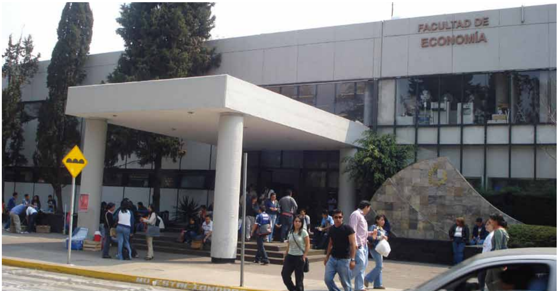
Facultad de Economía de la UNAM

E stoy profundamente consternado y triste por el accidente en la carretera de Toluca, en la que murieron 5 estudiantes y un joven profesor de la Facultad de Economía de la UNAM, así como 9 lesionados, quienes iban a Michoacán a un viaje de prácticas organizado correctamente. Doy clases en la misma desde 1978, con algunas interrupciones, 16 años laborados, con la gran fortuna de poder estar cerca de los jóvenes y recibir las luces de su vitalidad, un buen alumno es como un hijo exitoso, a los que no siempre los tratamos de orientar y conducir. Los muchachos accidentados son del segundo año de la carrera, mientras mis alumnos son del octavo al décimo semestre, a quienes llamé inmediatamente me enteré del mismo. Como en todo he tenido estupendos estudiantes, uno es Gobernador, otro Presidente del IPAB, aquel ha sido Presidente del Colegio Nacional de Economistas, muchos tienen posgrado y se dedican a la investigación.