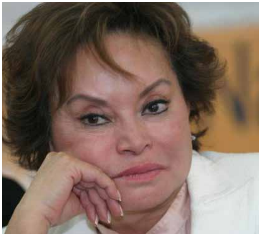
Elba Esther Gordillo

Resulta incuestionable, el panismo no puede volver gobernar México, han sido desastrosos los últimos doce años, e invariablemente con “Chepina” las cosas empeorarían, carece de carácter y personalidad, es obvio que no tiene la menor idea de lo que representa la enorme responsabilidad de estar al frente de un país.