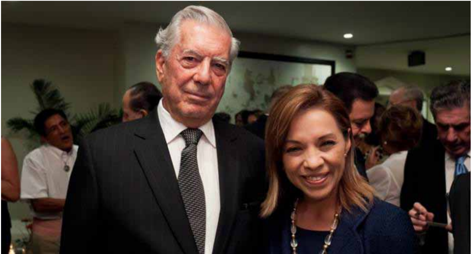
Vargas Llosa y Vázquez Mota

Alguna vez Mario Vargas Llosa, Premio Nobel de Literatura 2010, “metiendo las narices” en una nación que no es la suya, precisó que México con el PRI, se parecía a una dictadura perfecta; para colmo, recientemente apoyó a la anodina Josefina Vázquez Mota, y sin ser mexicano, expresó que debería ser ella la próxima presidenta. ¡Vaya sujeto! Qué diferencia tan abismal con Gabriel García Márquez, quien es respetuoso de la política y se dedica totalmente a la cultura.