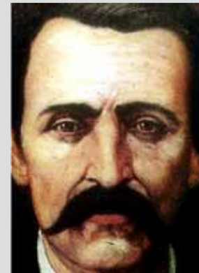
Por Francisco Zarco

ES PREGUNTA. ¿Ya empezó la guerra de lodo entre los candidatos presidenciales?