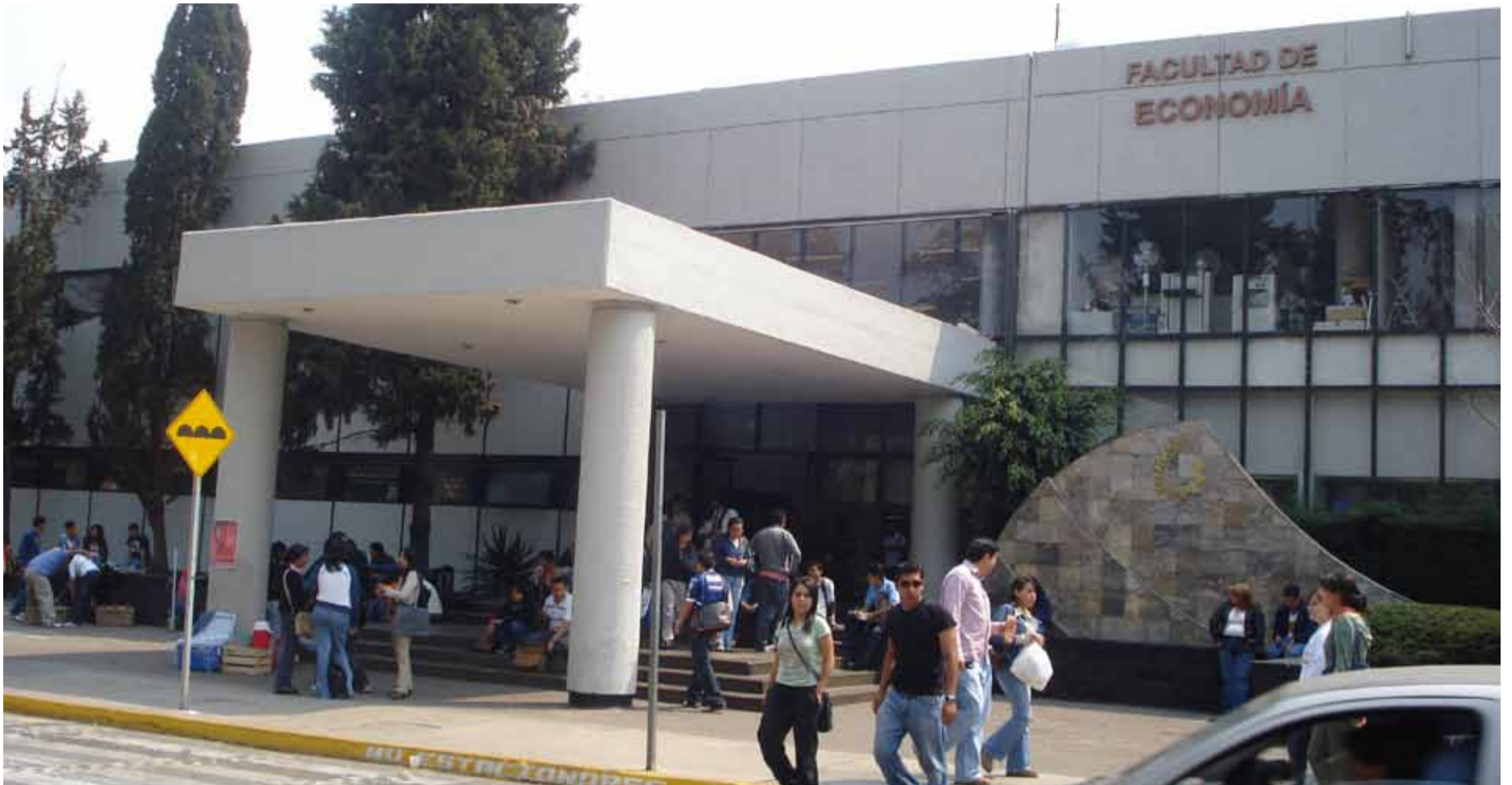
Facultad de Economía de la UNAM

E stoy profundamente consternado y triste por el accidente en la carretera de Toluca, en la que murieron 5 estudiantes y un joven profesor de la Facultad de Economía de la UNAM, así como 9 lesionados, quienes iban a Michoacán a un viaje de prácticas organizado correctamente. Doy clases en la misma desde 1978, con algunas interrupciones, 16 años laborados, con la gran fortuna de poder estar cerca de los jóvenes y recibir las luces de su vitalidad, un buen alumno es como un hijo exitoso, a los que no siempre los tratamos de orientar y conducir. Los muchachos accidentados son del segundo año de la carrera, mientras mis alumnos son del octavo al décimo semestre, a quienes llamé inmediatamente me enteré del mismo. Como en todo he tenido estupendos estudiantes, uno es Gobernador, otro Presidente del IPAB, aquel ha sido Presidente del Colegio Nacional de Economistas, muchos tienen posgrado y se dedican a la investigación.