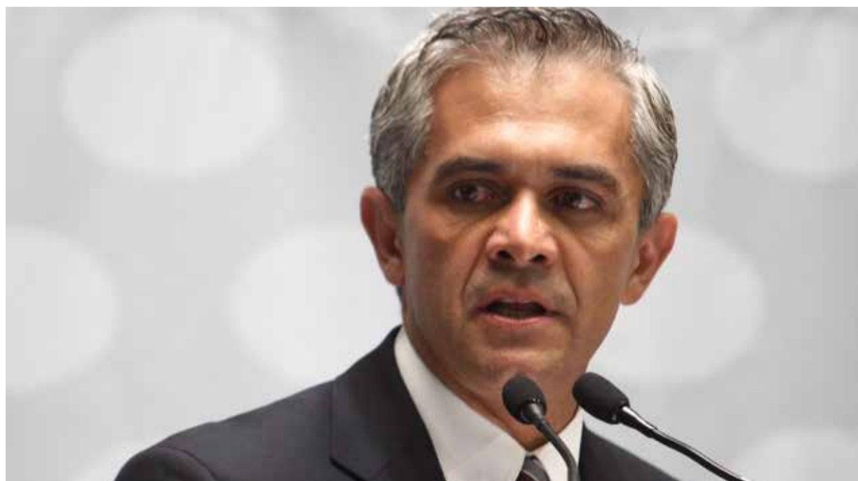
Miguel Ángel Mancera

Los espacios de Ortega son estrechos y sobre todo sin tiempo político, además de tener pululando a un Marcelo Ebrard --más del viejo PRI-- que quiere tomar por asalto el partido. De ahí que el PRD deba de analizar el 2013 hacia dentro y dejar de culpar a los demás de sus propios errores. Con todo y por el neopopulismo de López Obrador, el PRD podría ser la única opción de izquierda, pero a condición de rehacerse como partido realmente de izquierda y no una franquicia para ganar posiciones de poder. 18B