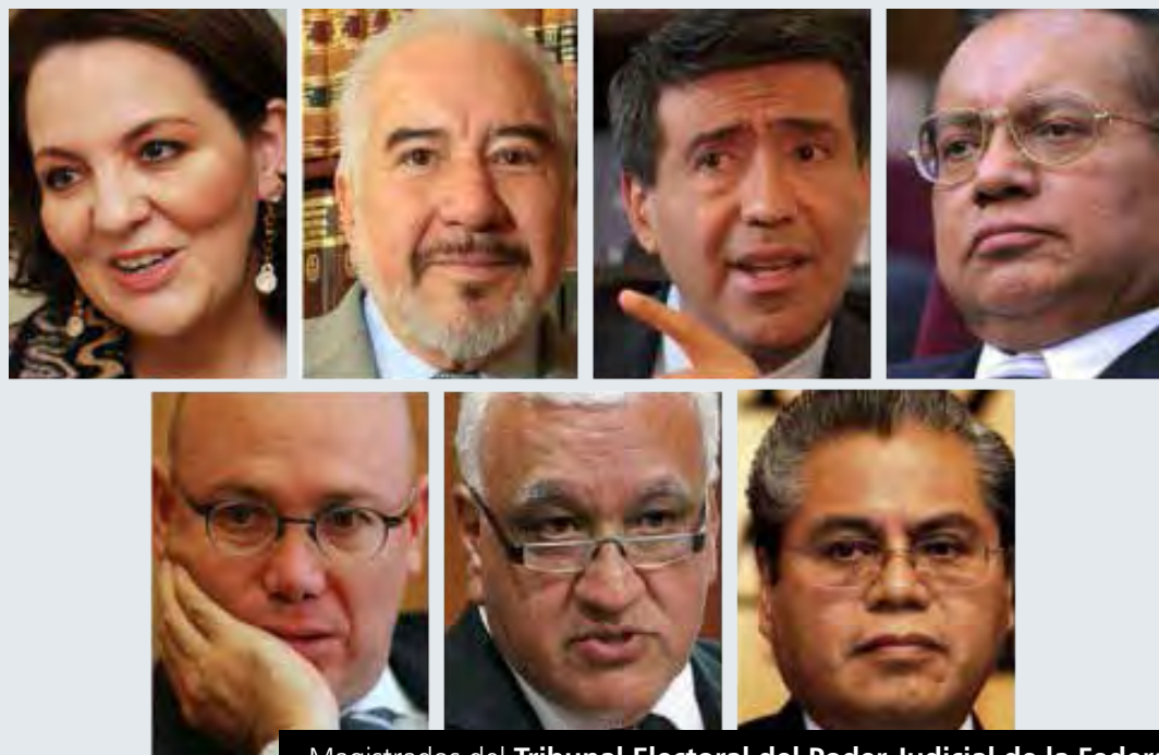
Magistrados del Tribunal Electoral del Poder Judicial de la Federación