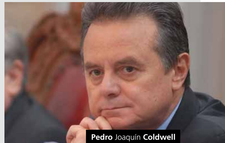
Pedro Joaquín Coldwell

Anteriormente para ocupar una secretaría debería "renunciar" el aspirante a sus negocios. Hoy abiertamente los opera. Pedro Joaquín quien como gobernador de Quintana Roo mostró congruencia y honradez se ha vuelto parte del equipo compacto neoliberal que tiene el control de la economía mexicana y que encabeza el secretario de Hacienda, Luis Videgaray a pesar de haberse comprometió en febrero pasado que en Pemex se establecería estricto programa anticorrupción para garantizar la transparencia en la nueva dinámica de contratos del sector petrolero "habrá cero tolerancia a la corrupción", precisó al inicio de año el funcionario que resulta tiene importantes negocios con la petrolera mexicana y dice no es corrupción,