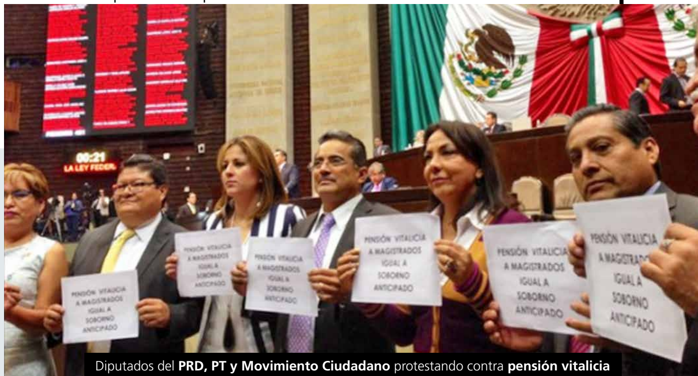
Diputados del PRD, PT y Movimiento Ciudadano protestando contra pensión vitalicia

Recordó que estas nuevas normas que integran el nuevo modelo electoral del país, surgieron con el consenso de las principales fuerzas políticas nacionales y han obtenido ya el aval de los congresos locales.