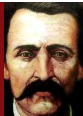
Por Francisco Zarco

noticiatransicion.mx revista18brumario@hotmail.com 18 Brumario es una revista política semanal editada por Grupo de Editores del Estado de México y el Grupo Editorial Transición. Las opiniones son responsabilidad de sus autores. Editor responsable: Carlos Javier Ramírez Hernández.