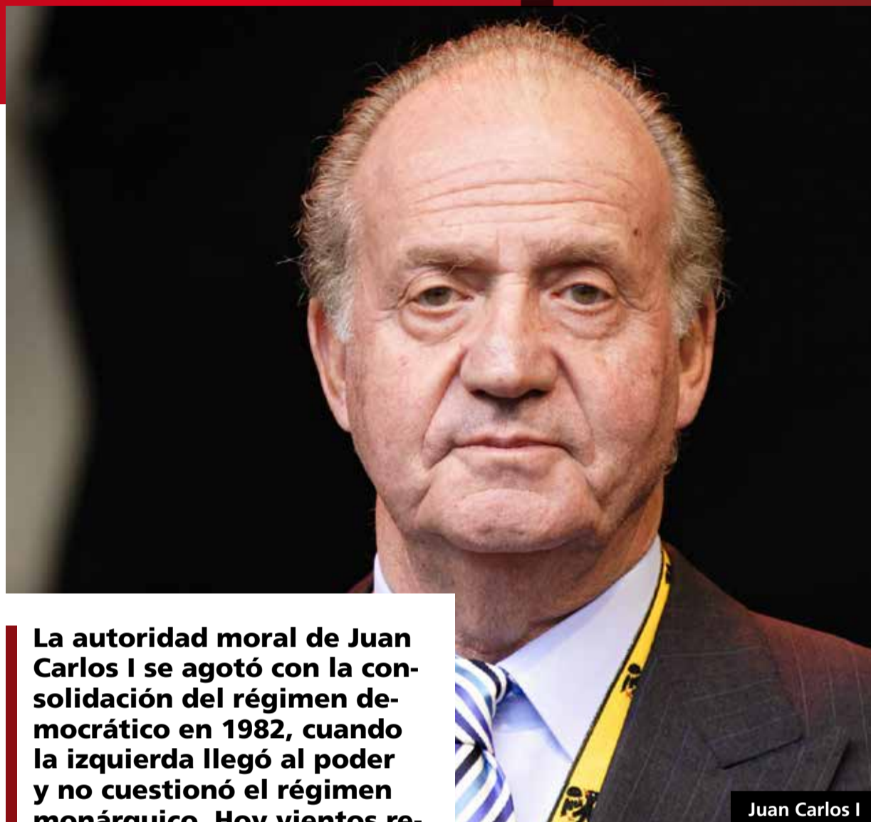
Juan Carlos I

A partir del principio del poder neutro que definió en 1815 el inglés Benjamín Constant de que "el rey reina pero no gobierna", Juan Carlos I consolidó la transición democrática, titubeó en 1981 cuando permitió que los militares quisieran deponer al presidente constitucional Adolfo Suárez para colocar a un militar como