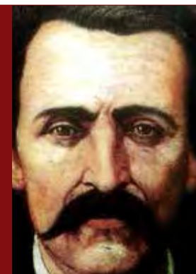
Por Francisco Zarco

noticiatransicion.mx revista18brumario@hotmail.com 18 Brumario es una revista política semanal editada por Grupo de Editores del Estado de México y el Grupo Editorial Transición. Las opiniones son responsabilidad de sus autores. Editor responsable: Carlos Javier Ramírez Hernández.