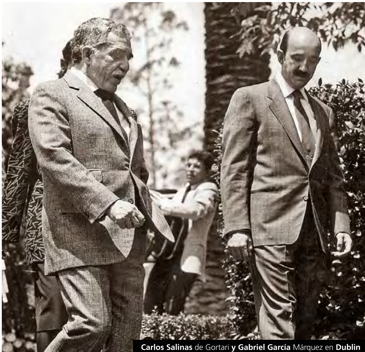
Carlos Salinas de Gortari y Gabriel García Márquez en Dublín

En torno del debate a la reforma energética el senador Emilio Gamboa asegura: "nos hemos conducido con apego a la ley, respetando, escuchando y atendiendo a todos los actores, es por ello que hasta el momento los dos primeros paquetes han sido objeto de alrededor de 140 modificaciones, lo cual es muestra de que hemos sabido realizar una propuesta incluyente para sacar adelante una mejor ley. 18B