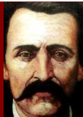
Por Francisco Zarco

18 Brumario es una revista política semanal editada por Grupo de Editores del Estado de México y el Grupo Editorial Transición. Las opiniones son responsabilidad de sus autores. Editor responsable: Carlos Javier Ramírez Hernández.