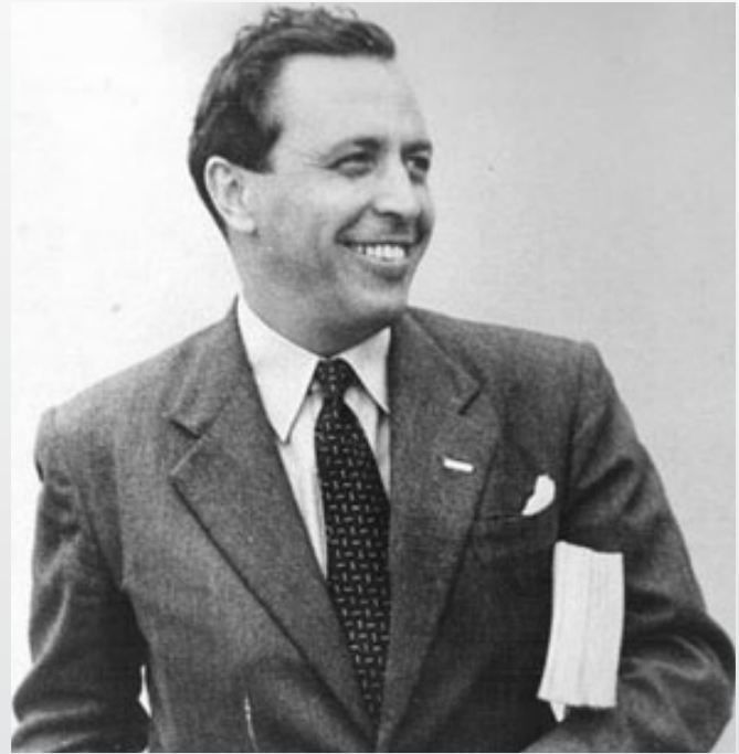
Manuel Gómez Morín

“Esta relación convergente entre la derecha religiosa y la derecha secular (es) analizada (...) para iniciar la exploración de la hipótesis que plantea observar al PAN como partido anticardenista y entender el sistema político mexicano como un espacio que cohesionó a las múltiples derechas a través de sociedades secretas-reservadas, instituciones de educación privada, empresarios, partidos políticos y facciones de la Familia Revolucionaria. Esta derecha se beneficia con el desarrollo estabilizador, reprime a las juventudes universitarias en los años sesenta —también bajo el argumento del judeocomunismo—, rompe con el régimen en el sexenio de López Portillo, regresa al poder con Salinas y, final-