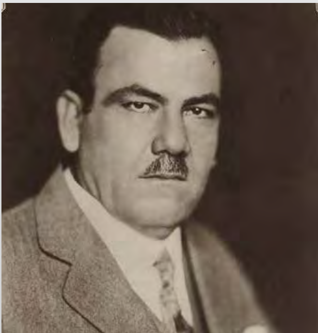
Plutarco Elías Calles

mente, logra la alternancia en el año 2000”.