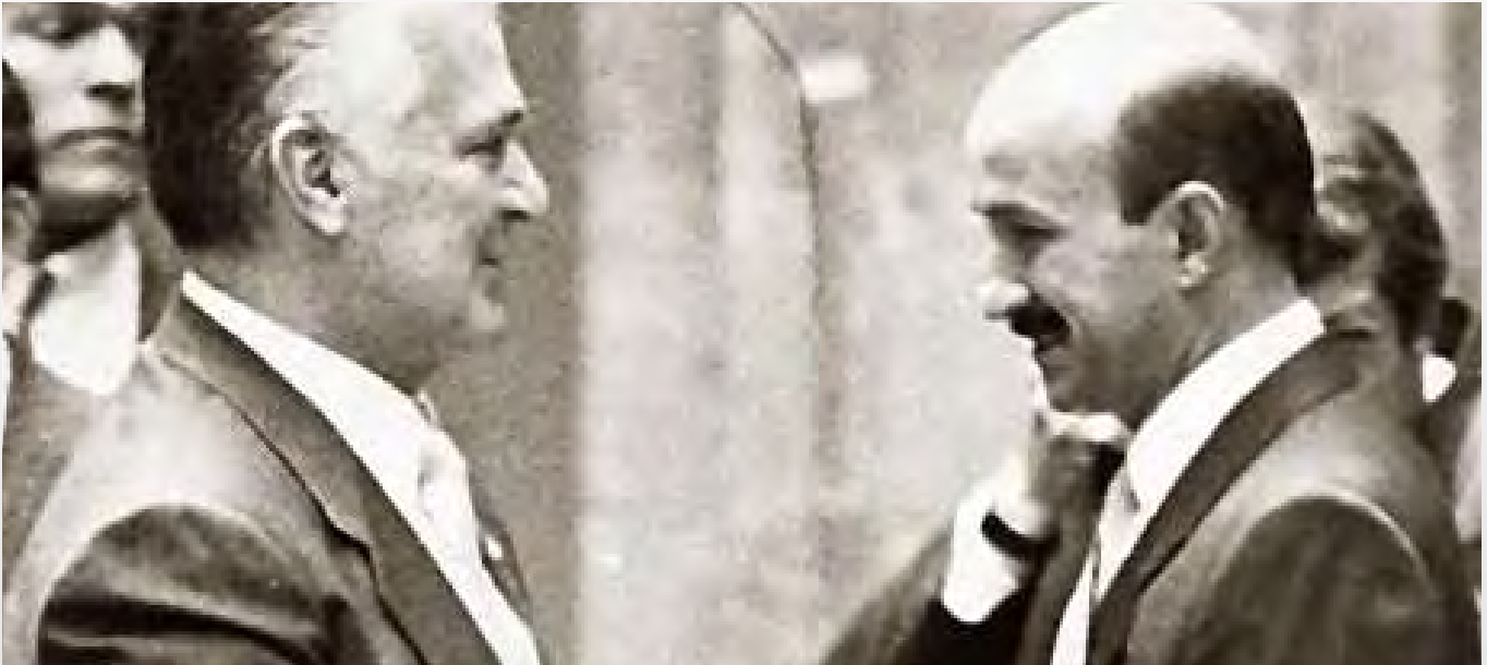
Miguel de la Madrid y Carlos Salinas de Gortari

El grupo De la Madrid-Salinas fijó la reforma del Estado abstrayéndolo del viejo modelo populista de servicio de las mayorías. Ahí, con el concepto de “ autonomía relativa ” del Estado, ocurrió la profunda reforma histórica del Estado. Y el proyecto salinista fijó la reestructuración ideológica en el periodo 1982-1994, con el apoyo de las élites intelectuales de dentro y de fuera del gobierno, algunos de los que ahora en la oposición se hacen distraídos de la complicidad con esas decisiones que cambiaron el rumbo del país.