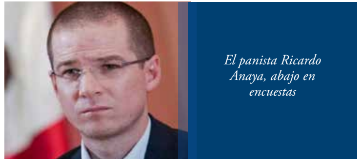
El panista Ricardo Anaya, abajo en encuestas

Sin embargo, Anaya carga el estigma de jugar chueco y no cumplir su palabra, como lo hizo con Gustavo Madero, exdirigente de ese partido y su mentor político. Para la alianza que encabeza Ricardo en panorama no es de optimismo y el tiempo avanza muy rápido. El panista Ricardo Anaya, abajo en encuestas.